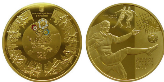
Рис 11. Фото: Серия «Спорт». Финальный турнир чемпионата Европы по футболу в 2012 г. Национальный банк Украины 38

Созданием отечественной монетной продукции на всех этапах занимаются профильные специалисты, в обязанности которых входит проектирование, конструирование, моделирование монет и внедрение художественных технологий из их отделки (инкрустации, состаривания металла, локальной позолоты, голограммы, тампопечати и т.д.) 39 .