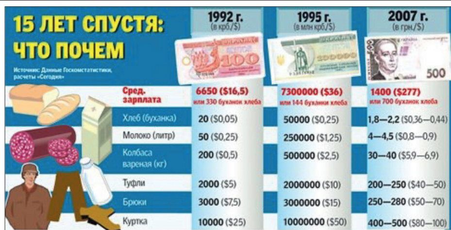
Рис.3 Покупательная способность населения Украины 15