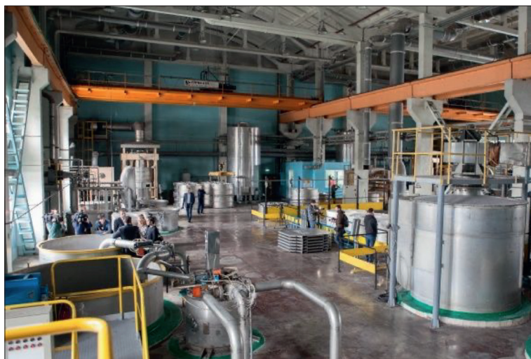
Рис 5. Фабрика банкнотной бумаги НБУ. 27

Готовые листы бумаги упаковывают и отгружают на Банкотно-монетный двор. Практически все процессы на производстве автоматизированы.