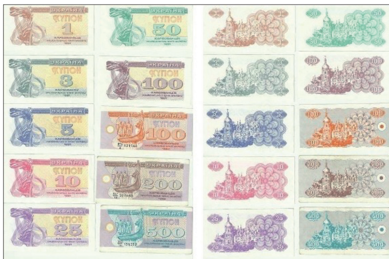
Рис. 2. Купонно-карбованці 12

Печатать эти купоны в Украине было негде, поэтому, как и во времена УНР, пришлось искать помощь за рубежом. Национальный банк Украины (далее: НБУ), заключил контракт на изготовление купонов с французской компанией «Imprimerie Speciale de Banque» и британской фирмой «Thomas De La Rue Company Limited» 13 .