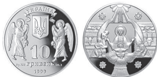
Рис 12. Фото: Серия «2000-летие Рождества Христова». Национальный банк Украины 41

во» признана лучшей монетой года в мире в номинации «Самая вдохновляющая монета».