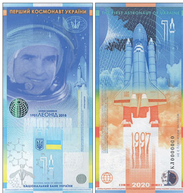
Рис. 10. Сувенирная банкнота «Леонид Каденюк — первый космонавт независимой Украины». Национальный банк Украины. Дата введения в оборот: 26 ноября 2020 36