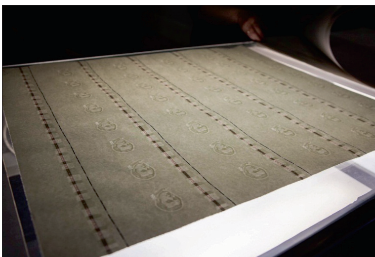
Рис 7. На Фабрике банкнотной бумаги НБУ. 28

Не все государства мира могут похвастаться полностью завершённым циклом производства – наличием фабрики банкнотной бумаги и банкнотно-монетного двора. Фабрика банкнотной бумаги выполняет немало заказов в Украине – бумага для