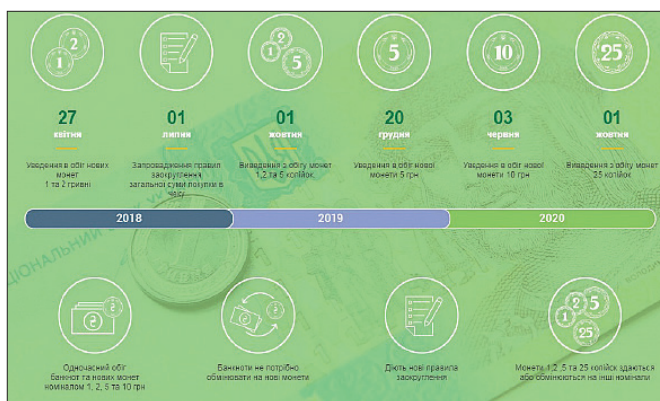
Рис. 9. Инфографика Национального банка Украины 35

Монетный двор введен в эксплуатацию в 1998 году. В соответствии с Указом Президента Украины «Об исключительном праве Банкнотно-монетного двора Национального банка Украины» от 10 сентября 1996 г. 34 Банкнотно-монетному двору (далее: БМД) было предоставлено исключительное право на осуществление деятельности относительно обеспечения потребностей НБУ в банкнотах и монетах массового обращения. Благодаря этому наше государство имеет полностью завершённый цикл производства.