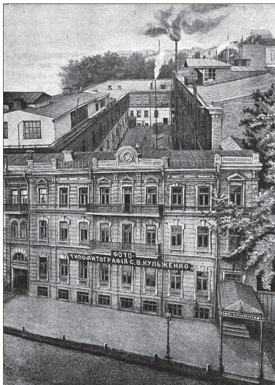
Рис 1. Здание типографии Кульженко в Киеве, где в декабре 1917 г. методом литографического печати изготовили первые украинские деньги. Также здесь печатали почтовые марки Украинского Государства и УНР 4

Такой шаг был связан с необходимостью улучшения качества и степени защищенности украинских денег, которое обеспечивала печатная база немецкого государства. Одновременно не прекращалась печать денежных знаков в Украине. Наряду с этим проводились мероприятия по созданию собственной высококачественной технической основы для производства денег, в которых главное место занимала Экспедиция заготовок государственных бумаг (Э.З.Г.Б.) 5 . В Германии проводились закупки оборудования для украинского монетного двора, который в силу неблагоприятных обстоятельств так и не был до конца сформирован 6 .