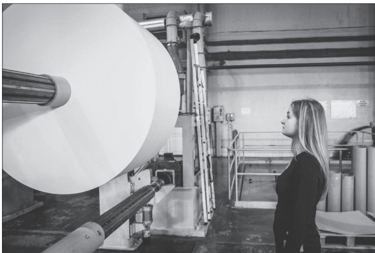
Рис 6. На фабрике банкнотной бумаги НБУ.